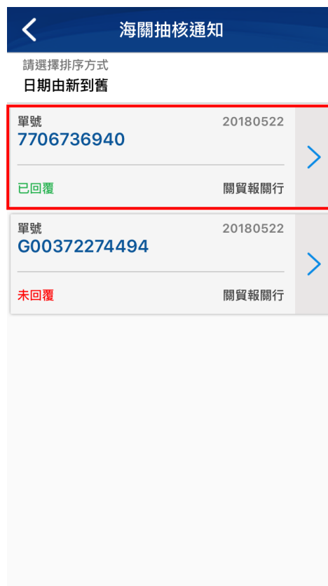
【圖24】 APP 海關抽核通知回覆完成畫面

海關抽核回覆成功後，回到前面畫面時可看到該筆貨物的狀態已改成綠色”已回覆”的狀態，即可繼續進行下一筆的確認作業。