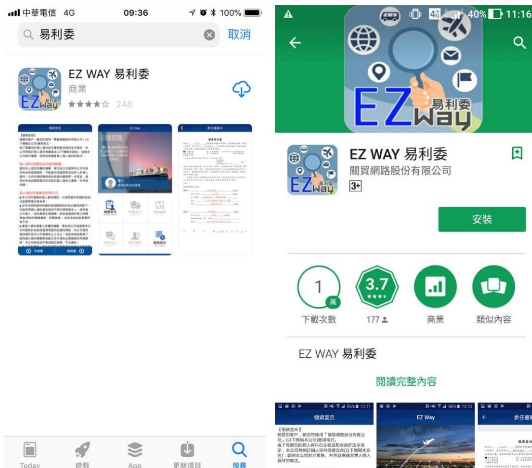
【圖8】 安裝 EZWay 易利委畫面

IOS 與 Android 第一次安裝時請於 App Store 與 Google Play 查詢輸入易利委，進行 EZWay 易利委安裝作業。