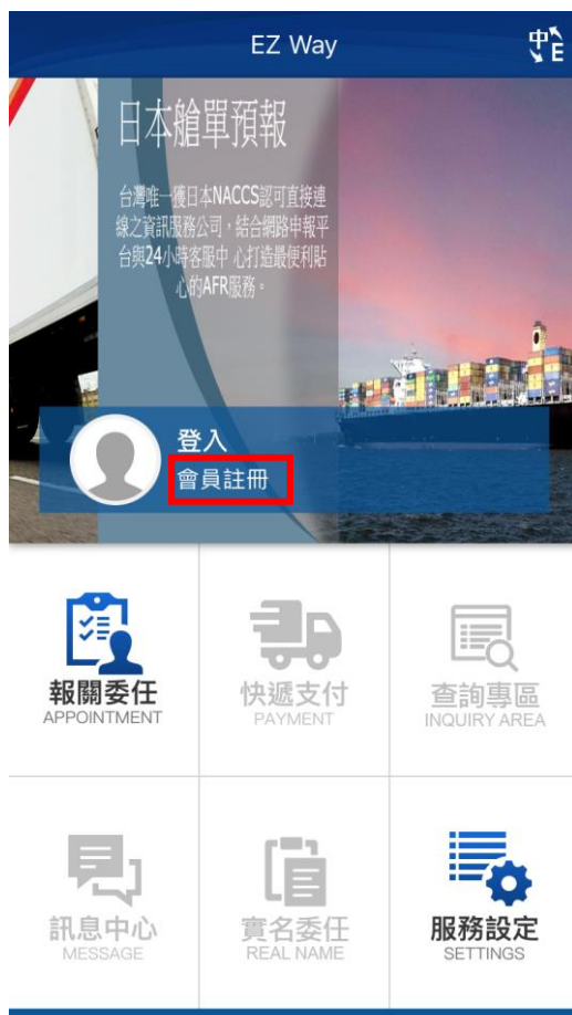
【圖9】 EZWay 登入畫面

手機門號實名認證註冊與委任、抽核確認作業，是經由 5 大電信業者確認手機門號與身分證號碼是否相同，故欲使用實名認證之手機門號如非本人所有， 或使用公務機門號者皆無法申請實名認證作業 ，申請與使用時須注意符合以下幾點：