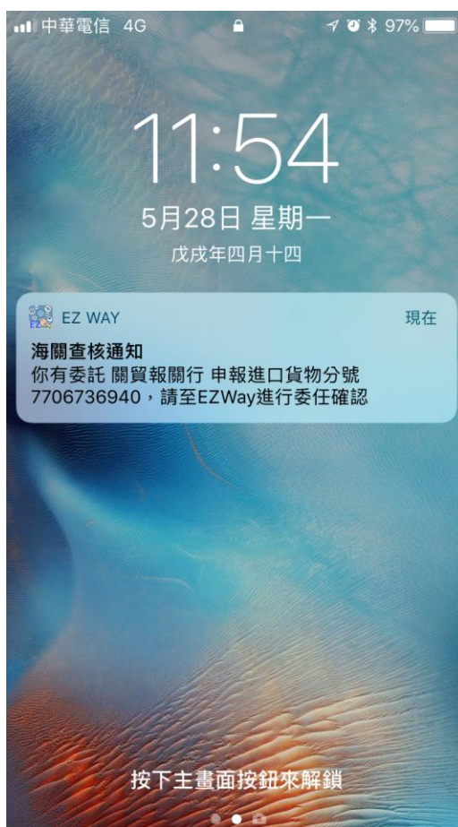
【圖19】APP 海關抽核通知畫面

當手機收到如下圖的海關查核通知時，代表您有一筆進口貨物經海關抽核，需於線上進行回覆與確認作業，請開啟 EZWay 易利委進行海關抽核確認作業。