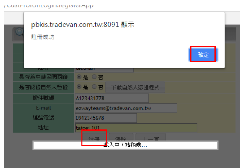
【圖28】 自然人憑證註冊綁定成功畫面

自然人憑證驗證作業通過後，請按下〔註冊〕鍵，畫面會出現 ”註冊成功”代表自然人憑證已綁定及註冊成功如【圖 28】。