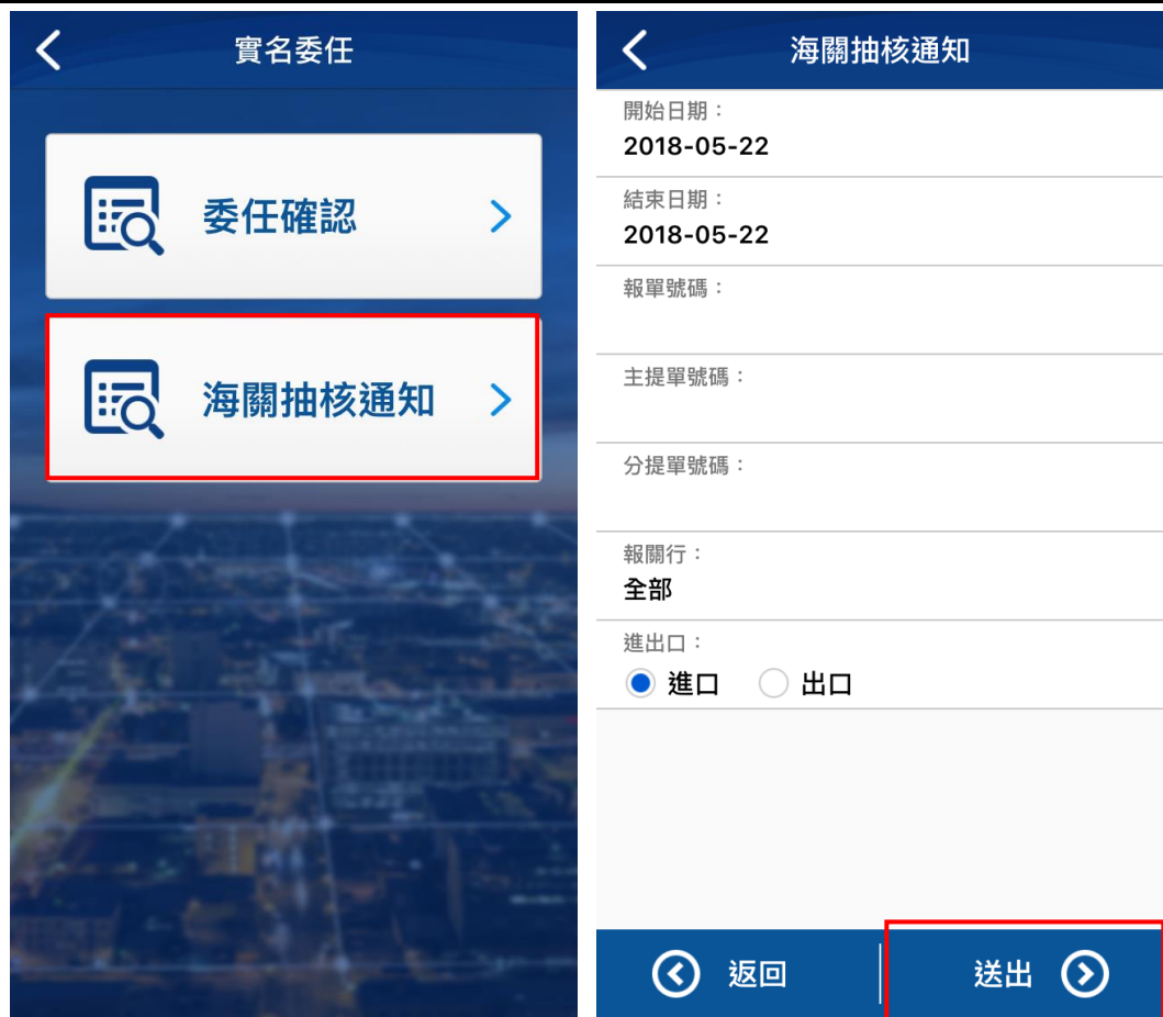
【圖21】APP 海關抽核通知查詢畫面

查詢完成後如下圖所示，系統將逐筆列出經海關抽核的通知紀錄，請逐筆點選瀏覽內容並且確認回覆。