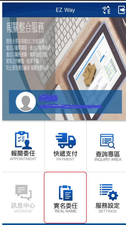
【圖20】 APP 登入畫面

執行 EZWay 易利委 APP，點選〔實名委任〕，執行〔海關抽核通知〕，預設查詢日期起迄為前一日與當日；