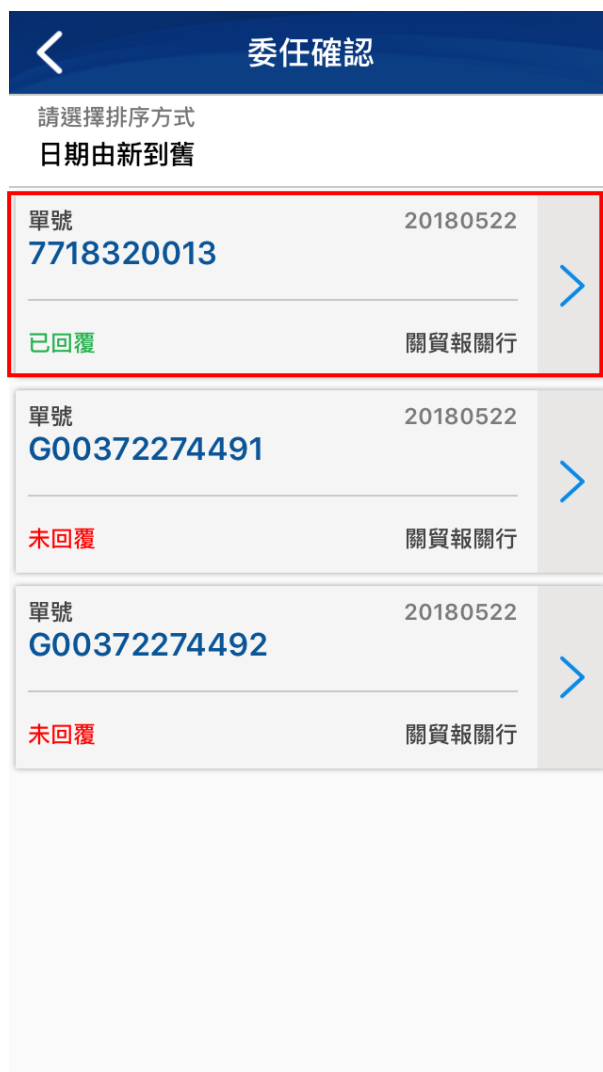
【圖18】APP 委任確認回覆完成畫面

委任成功後回到前面畫面時可看到該筆貨物的狀態已改變成綠色”已回覆”的狀態，即可繼續進行下一筆的確認作業。