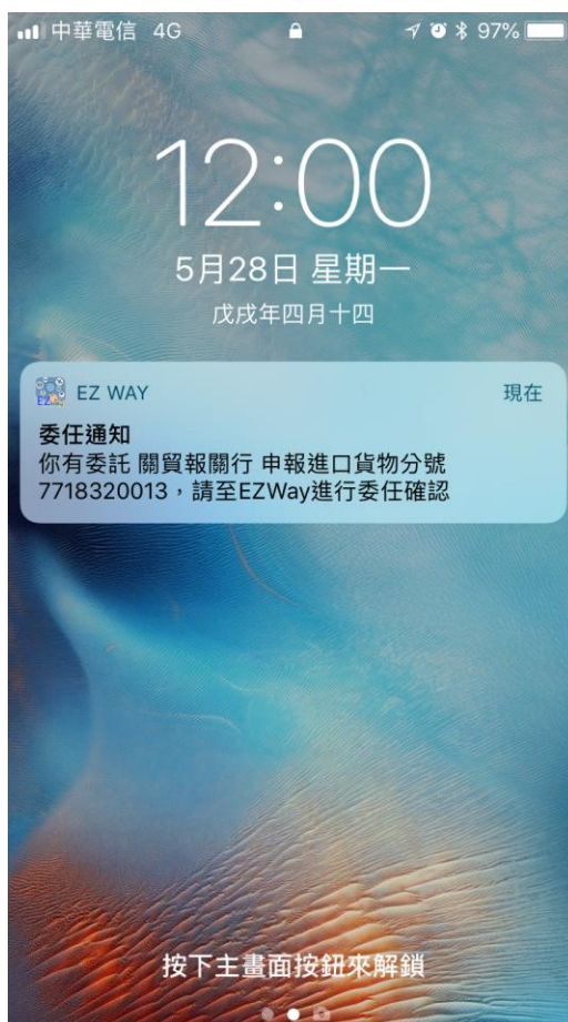
【圖13】手機收到 APP 委任通知

當手機收到如下圖的委任通知時，代表您有一筆進口貨物已由委託的報關業者完成報單申報，請開啟 EZWay 易利委進行委任確認作業。