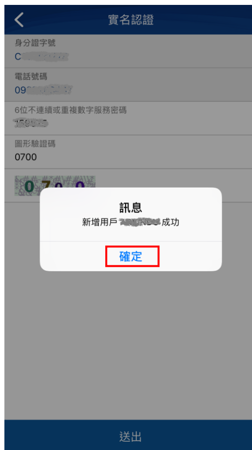
【圖12】APP 實名認證註冊成功畫面

輸入認證資料確認無誤後，按下方的〔送出〕確認進行實名認證註冊，畫面顯示〔新增用戶成功〕後，即代表已成功完成實名認證之註冊作業。