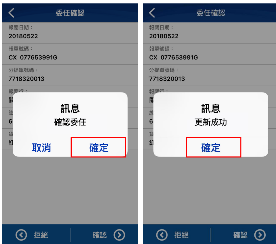
【圖17】APP 委任確認回覆畫面